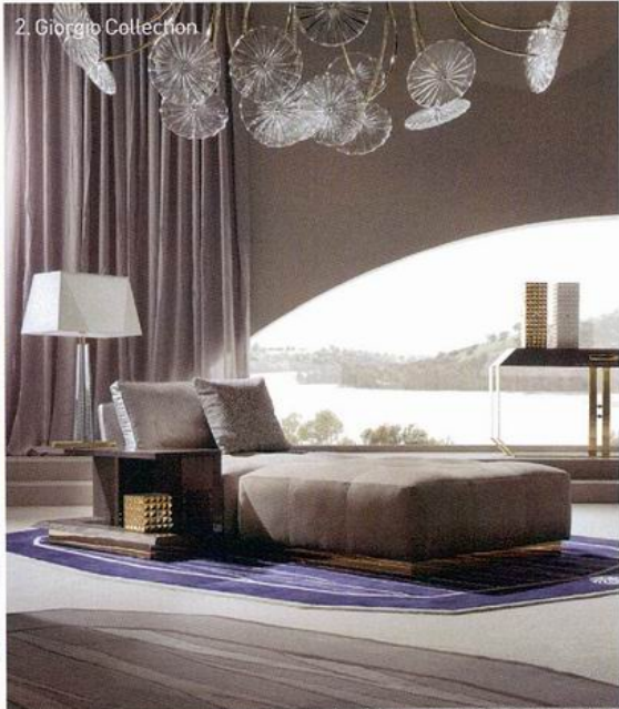
2. Giorgio Collection